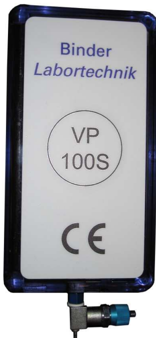
Figure 1: Mini-Exsikkator

Im Lieferumfang ist eine gebogene Ansaugnadel mit 0,7 mm Durchmesser enthalten.